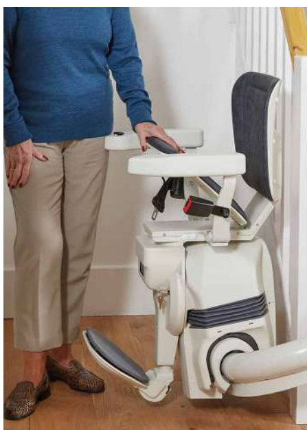
Asiento y reposapiés enlazados