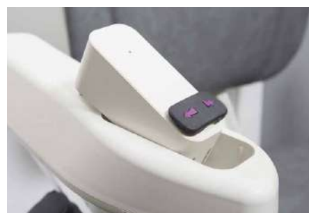
Elección de controles