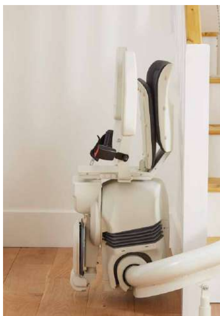
Ocupa muy poco espacio