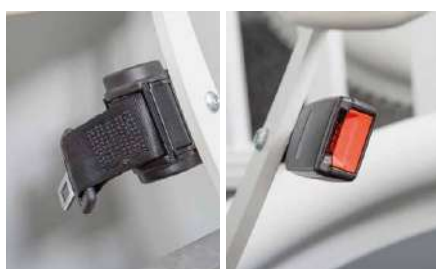
Cinturón de seguridad