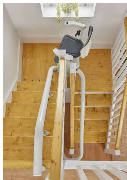
Con guía monorraíl